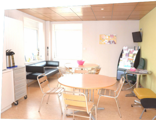
Salon de repos